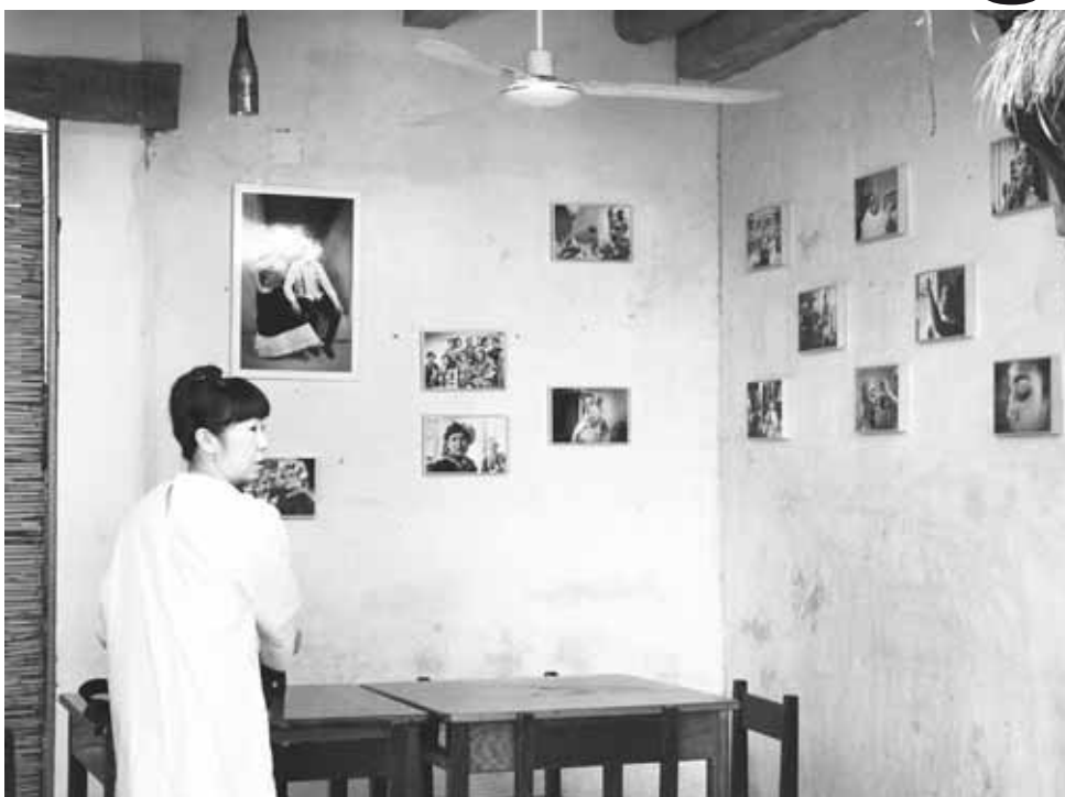
► La fotógrafa señaló que quiere expresar el lado positivo de la cultura muxe.

Explicó que le gusta mucho acercarse a las comunidades en donde tiene un sentido de relaciones muy fuerte, por lo que tomando fotos se dio cuenta que aparece esa fuerza dentro de las fotos que ha tomado a las