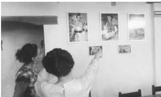
► La mayor parte de las fotografías presentadas fueron tomadas en 2015.