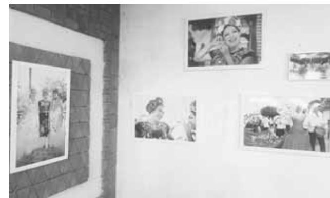
► En la muestras se muestran las cualidades de los muxes como seres humanos.